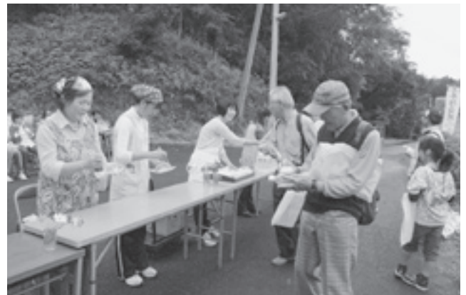
休憩地点の「根古谷の館」では地元の方々からおにぎりや漬物などがふるまわれました