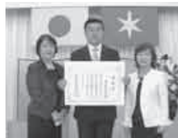
表彰状を手にする酒々井町文化協会の方々