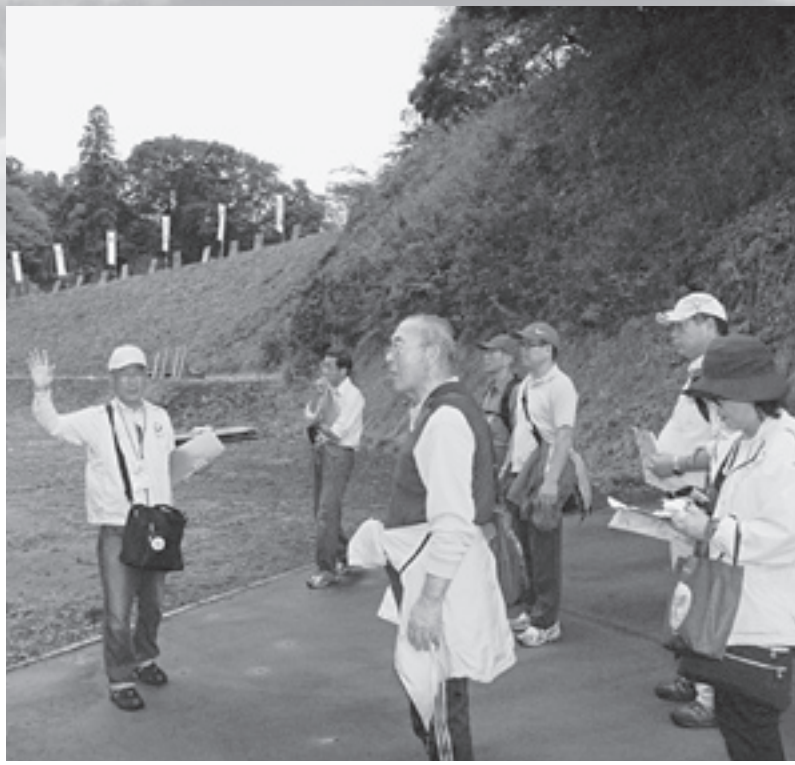
ボランティアガイドの詳細な解説のもと、戦国時代千葉氏の居城である「本佐倉城跡」を隅々まで探索しました

コースの途中では、酒々井地区や根古谷地区、里山フォーラムの方々から、おにぎりや焼芋などがふるまわれ、参加者からは「地元の方々の温かさに触れ、気持ちよく歩きました」などの声が聞かれました。