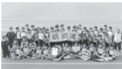
県ユース大会で優勝した順蹠F Aのメンバー

なお、11月5日から開かれた関東大会では、川崎フロンターレU-15を相手に先制するも後半に逆転を許し、2対4で敗退しました。