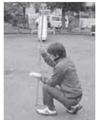
放射線量を測定する町職員

※町では今後も、多くの地点での測定を行い、安心していただけるように、さらに測定器を購入して実施していく予定です。