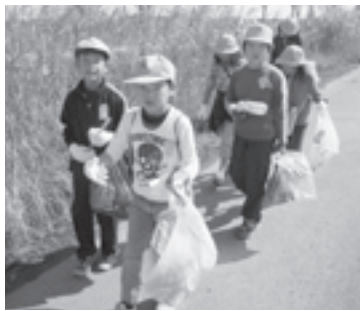
みんなでごみを拾ったよ

「印旛沼をきれいにする会（町婦人会）」主催による『印旛沼中央排水路周辺一斉清掃』が、印旛沼浄化推進月間の10月28日に行われました。当日は、酒々井小学校4年生も参加し、印旛沼土地改良区の方から印旛沼の歴史などの説明を聞いた後、約1000