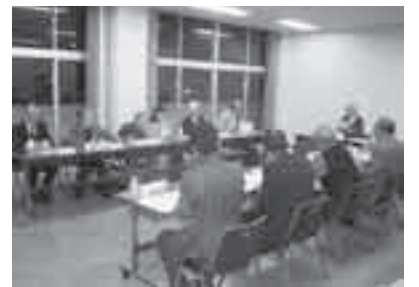
町民から多くの意見が出された、総合計画懇談会(計10回開催)の様子

さらに、限られた財源の中、中長期的な視点で基金の積立を行うなど、将来にわたる健全で効果的・効率的な財政運営の取り組みにより「持続可能で自立したまち」の実現を目指します。