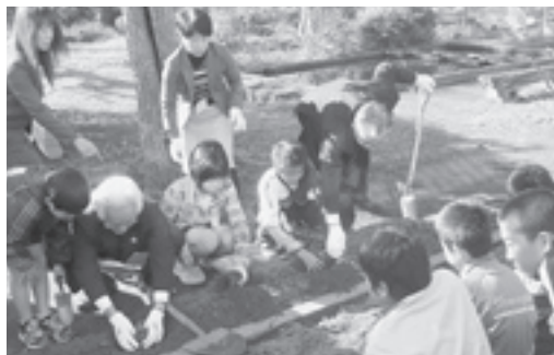
人権擁護委員と球根を植える子どもたち

人権の花「シャクヤク」の植樹式が11月17日、酒々井小学校で行われ、6年生の児童と千葉地方法務局佐倉支局長、町人権擁護委員、教育長が参加し球根を植えました。