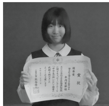
問い合わせ 学校教育課 学校 教育班 ☎(382) 2345

「そのハンドル握っているの？事故がおきてからじゃもう遅い。相手の未来や希望を無くしてしまう。飲酒運転は犯罪です。周りの人の命や自分の命を失う前にもう一度よく考えて。」