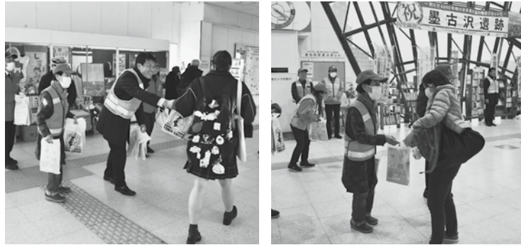
キャンペーンの様子

12月9日、ＪＲ酒々井駅自由通路において、佐倉交通安全協会、防犯ボランティア団体および町職員が合同で、酒々井町歳末特別警戒キャンペーンを実施しました。 キャンペーンでは、年末に増加が懸念される強盗や空き巣、振り込め詐欺などの犯罪防止と、飲酒運転の根絶や自転車交通ルールの遵守などの注意を呼びかけるとともに、チラシなど啓発物資を配布し、ご家族への周知を依頼しました。 町では今後も各団体と連携し、防犯や交通安全など啓発活動を実施していきます。 問い合わせ くらし安全協働課危機管理室 ☎(496) 1164