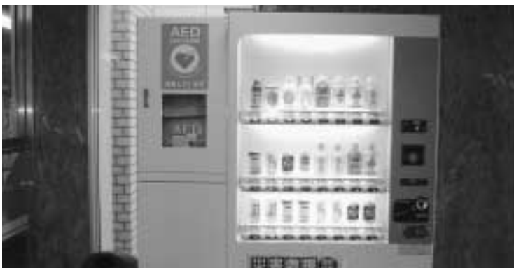
役場玄関に設置されたAEDを搭載した自動販売機