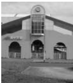
3か所のピロティー

ロータリー左側の駅前広場については、道路敷地としてこれまでも数回イベント等で利用した。一時使用は占用等により利用できる。