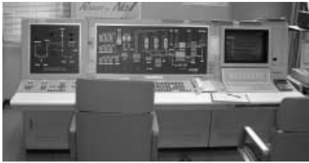
尾上浄水場「中央監視システム」

しました。今後は、今回の故障を踏まえ、施設の点検に努めるとともに、緊急時の運転操作マニュアルの見直し作業を進めていきます。