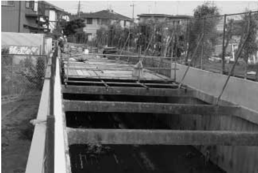
中川流域防災事業「排水路の嵩上げ工事」