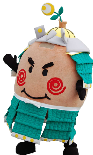
「酒々井の教育」 推進マスコットキャラクター 勝っタネ!くん