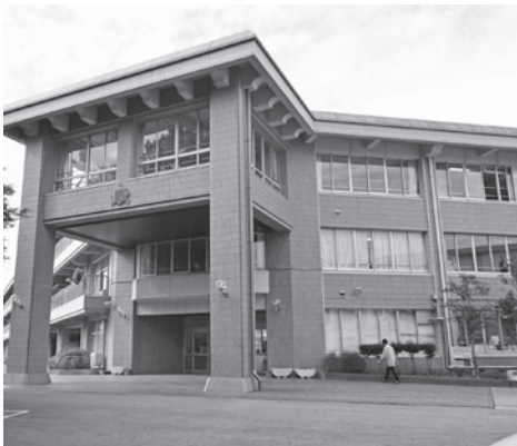
徴収金の紛失事故があった酒々井小学校

学校教育課長 酒々井小学校の徴収金 の紛失事故は、警察の捜査は継続して いるが、特に進展はない。今回の事故 については、町が加入している賠償保 障保険の対象にならないものであった。 紛失した徴収金を校長が弁済したの は、本人に重大な過失があると自ら認 めて教育委員会に申し出たこと、また、 被害者である保護者の了承も得ている ことから自己弁済に至ったものである。