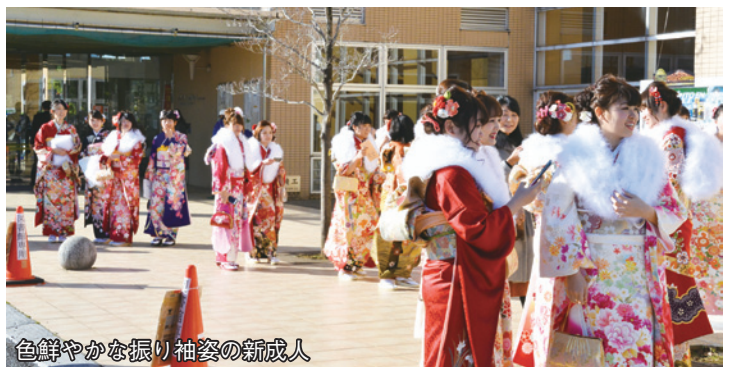
色鮮やかな振り袖姿の新成人