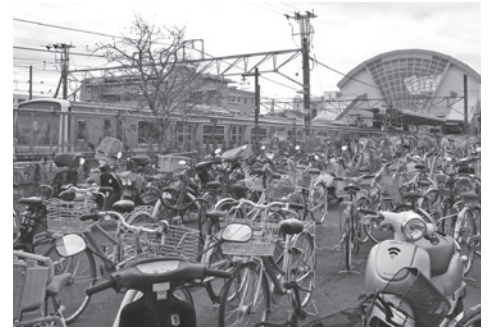
駐輪場の整備で防犯力の向上が期待できます

今回の補正は、歳出では、酒々井中学校グラウンド用地購入費、酒々井小学校用地購入費、町道021009号線道路改良事業、JR酒々井駅自転車等駐車場整備事業、障害者福祉関係経費として障害児給付費や障害者医療費、児童福祉関係経費として保育委託費、児童生徒国際交流振興事業としてドイツドルフェン市との児童交流事業経費などの他、今年度の人事院勧