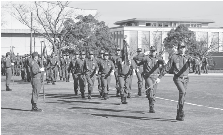
勇ましく分列行進を行う消防団員

年が明け最初の土曜日となった1月6日に町消防出初式が中央台公園で開催されました。