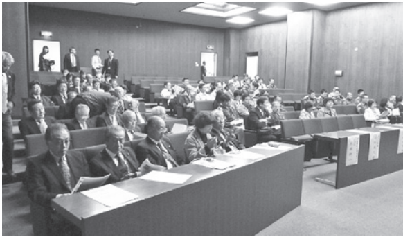
被害を最小限に抑えるには正しい知識を得ることが大事

平成29年11月9日に栄町役場の庁議室で印旛郡町村議会議員自治研修会が開催され、当町の議会議員および職員、栄町議会議員および職員(消防職員含む)が参加しました。