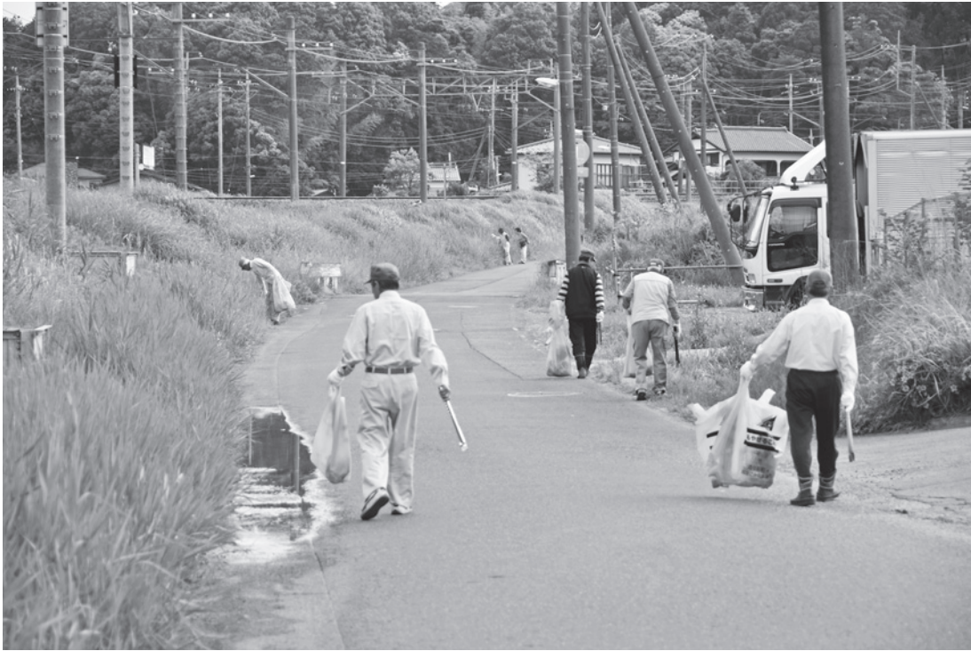
ごみが散乱していない清潔できれいなまちづくりが期待されています（写真は過去のゴミゼロ運動）