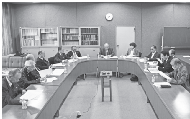
今回の議会改革は議会全般の事項を審議していくこととなります