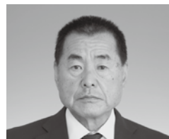
江澤 眞一 議員