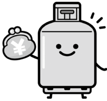
LPガス利用世帯へ5,000 円の 支援金を支給します

問 国はエネルギー高騰対策として電気や都市ガス料金の補助を実施しているが、LPガス料金への補助はなかった。そこで地方創生臨時交付金を活用して、自治体はLPガス料金の補助を行うようにと発表した。町の考えを伺う。 町長 LPガス料金の上昇の影響を受けている世帯の負担軽減のため、一世帯あたり5千円の支援金を、今議会の補正予算に計上している。令和5年4月1日現在で住民基本台帳に記載されている世帯でLPガス契約者、または使用者、個人を対象として申請していただき、審査後に希望口座に入金する方法を考えている。