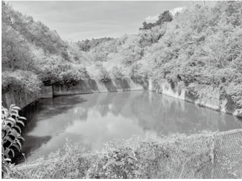
調節池とは河川に雨水等が一気に流れ込まないように一時的に貯水する池です ※画像はイメージです