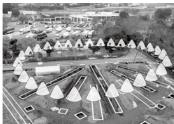
日本最大級の規模を誇る旧石器時代の墨古沢遺跡

問 墨古沢遺跡整備基本計画における整備費用、維持管理費、運営費の額は、生涯学習課長 作成中の基本設計の完成が3月下旬のため、答弁はできない。