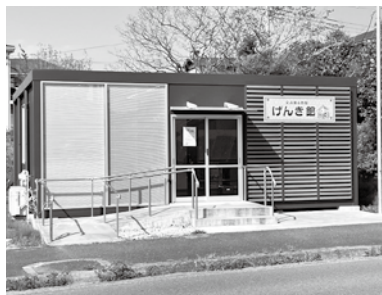
高齢者と多世代の交流の場となる「げんき館」

健康福祉課長 オープン以来1年半が経過し、げんき館は地域に定着し始めており、ニーズに応えるイベントを開催している。令和4年度(9カ月間)は1611人、令和5年度(12月末までの9カ月間)は3176人と増えており、1日10人程度の来館者があり賑わいを見せている。