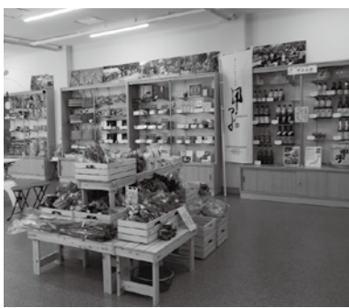
まるごとしすいの内観

多様化する住民ニーズにより効果的、効率的に対応するため、公の施設管理に民間のノウハウを活用しながら住民サービスの向上と経費の削減を図ることを目的とした制度です。