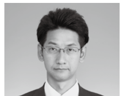
小坂 和也 議員