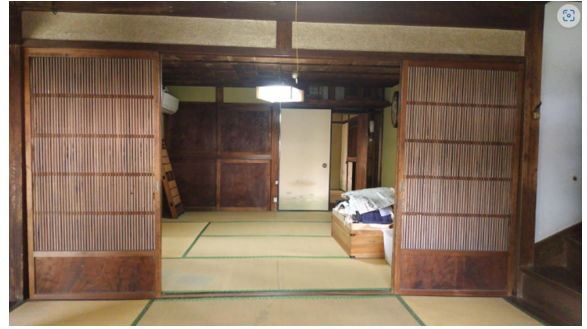
旧相川家店と店奥