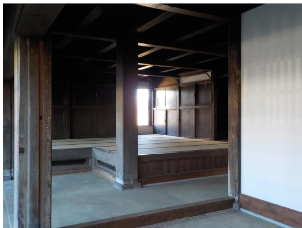
旧蒔家店舗内部（玄関土間から望む）