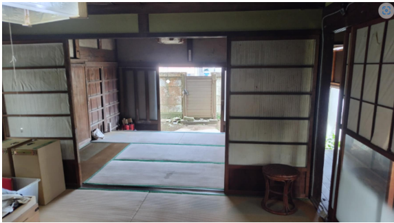
旧相川家店奥・店