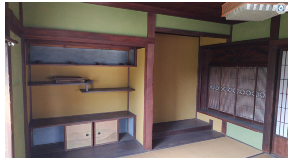
旧相川家2階床の間