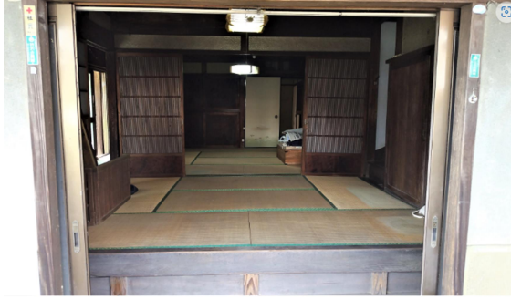
旧相川家土間から店