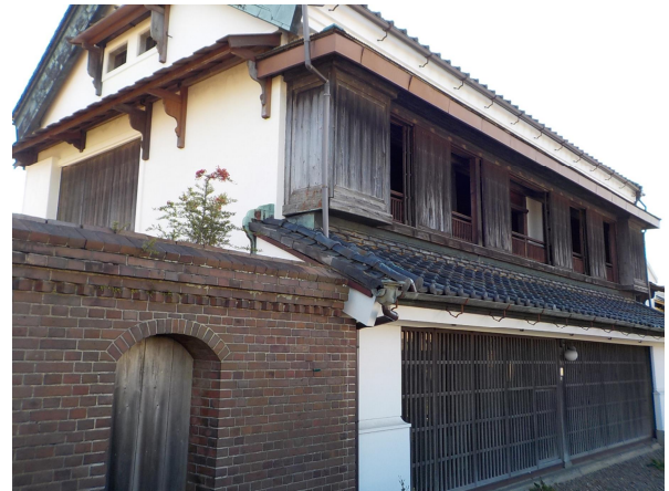
旧蒔家（裏手より全景）