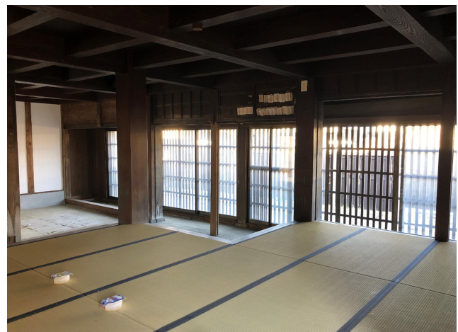
店舗内部（北側から玄関土間を望む）