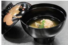
「御吸物(おすいもの)」