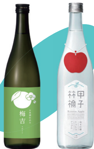
千葉のめぐ実 酒蔵の梅酒 梅吉