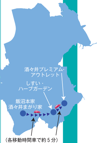
(各移動時間車で約5分)