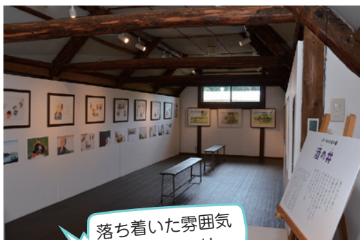
落ち着いた雰囲気の二階ギャラリー

まがり家は元々新潟県の清野邸として使われていた民家を移築再生しています。伝統的な民家は風情があり歴史を感じるとともにその時代の良さを直接感じ取ることができます。現在、まがり家には宿泊施設がないので今後の発展にも注目していきたいです！