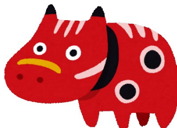
会津の特産品：赤べこ