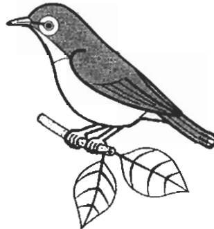
町の鳥「メジロ」 (平成 6 年制定)