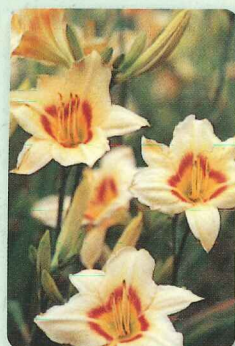
スイートハーモニー