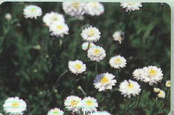
ダブルフラワーカモマイル