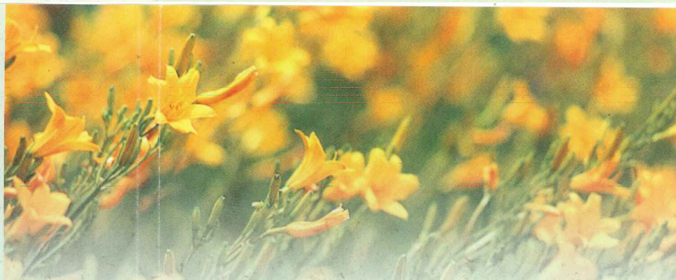
パトリシヤフェイ