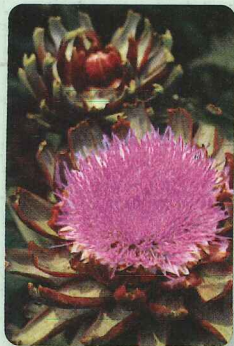
アーティチョーク