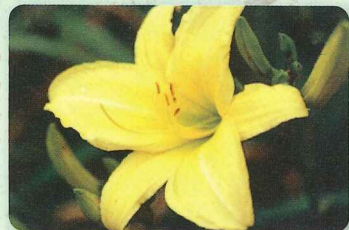
カートホイールズ