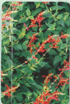
パイナップルセージ