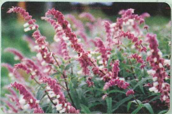
メキシカンセージ