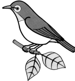
町の鳥「メジロ」 (平成 6 年制定)