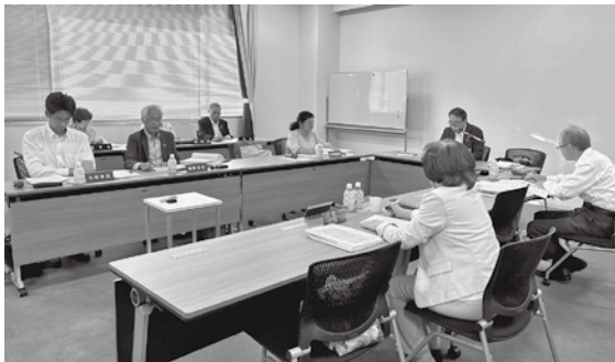
より詳細な審議が行われる委員会