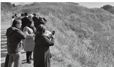
馬橋川沿岸の盛土の現場

1月27日に「馬橋川盛土緊急対策事業（馬橋川対策工事）」及び「中川調節池工事」の現地調査を実施しました。 担当課より、工事の概要や工事後の効果など説明を受け、議案審議にあたり、詳細な情報を得ることができました。