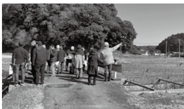
上岩橋地区に設置する 中川調節池予定地