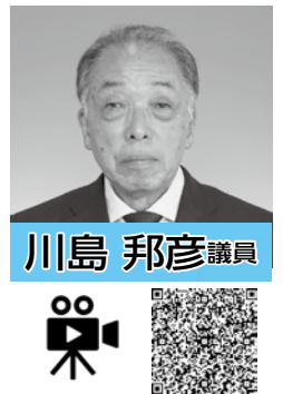
川島 邦彦 議員