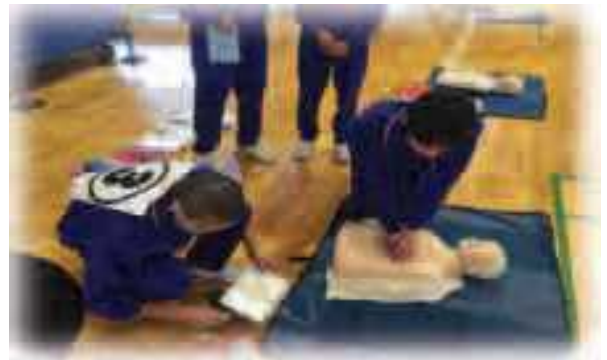
人権教育（酒々井中学校）