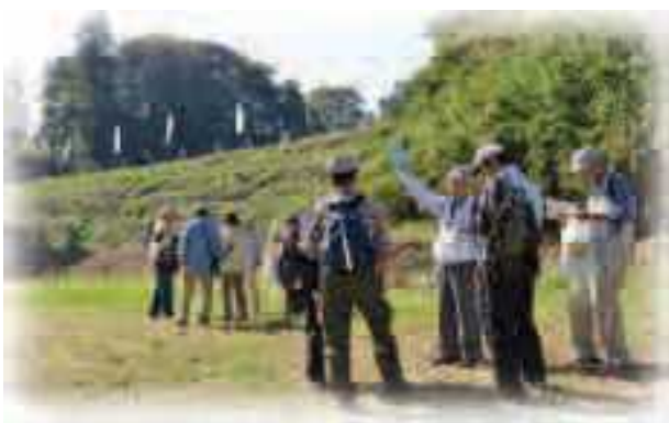
史跡ウォーキング