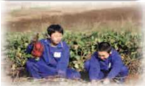
キャリア教育（職場体験）