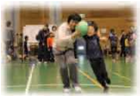
スポーツ・レクリエーション大会