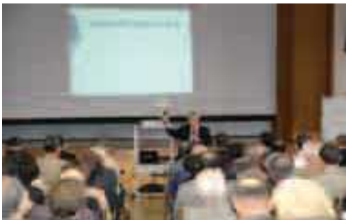
青樹堂師範塾授業風景