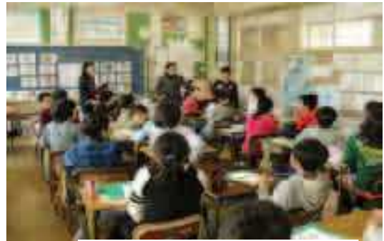
ALTによる英語の授業