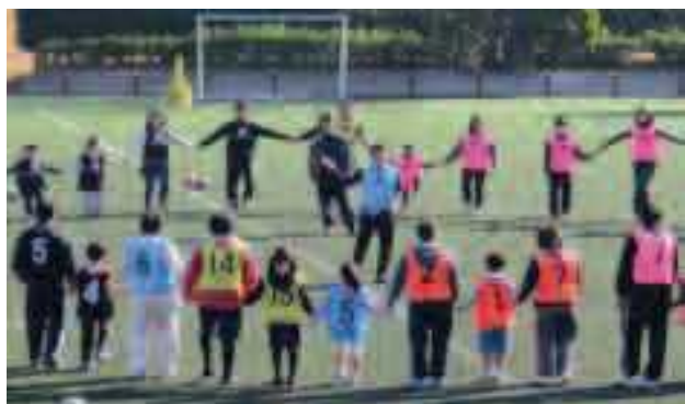
順天堂大学生涯学習公開講座