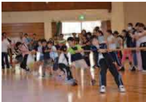
スポーツ・レクリエーション大会