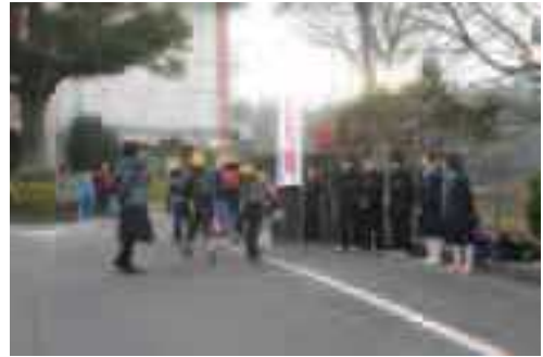
朝のあいさつ運動