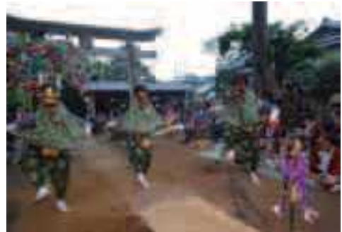
馬橋の獅子舞（町指定無形文化財）