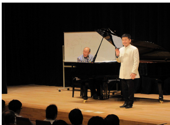
人権教育セミナー