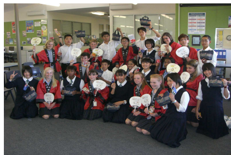
国際交流派遣事業（オーストラリア）