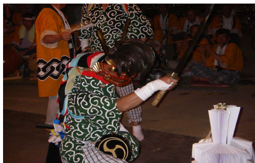
墨の獅子舞（県指定無形文化財）