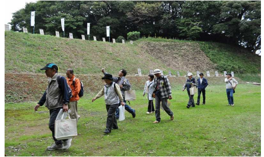
史跡ウォーキング 本佐倉城跡