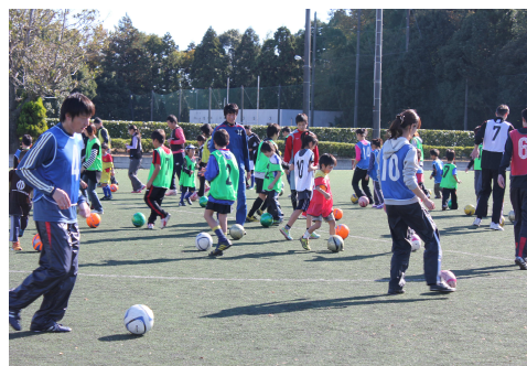
順天堂大学生涯学習公開講座