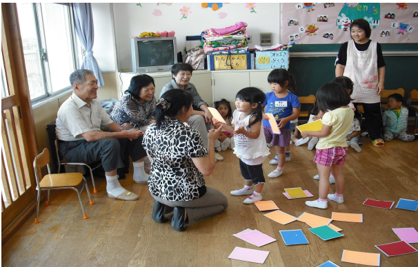
保育園の英語活動