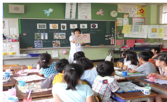
栄養士によるきめ細かな栄養指導