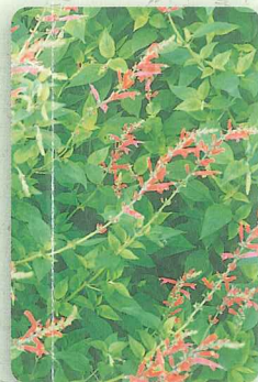
バイナップルセージ