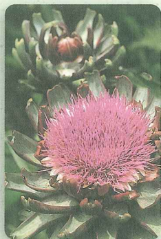
アーティチョーク