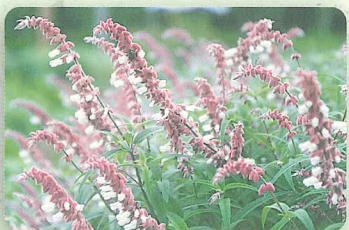
メキシカンセージ