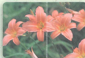
バトリシヤフェイ