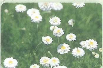
ダブルフラワーカモマイル