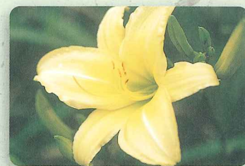
カートホイールズ