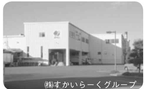
(株)すかいらーくグループ

問い合わせ 産業課商工観光班 ☎④ 1 4 5 まちづくり課都市整備班 ☎④ 1 5 5